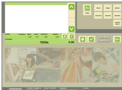
Écran principal POS