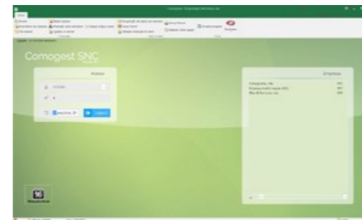
Écran principal POS